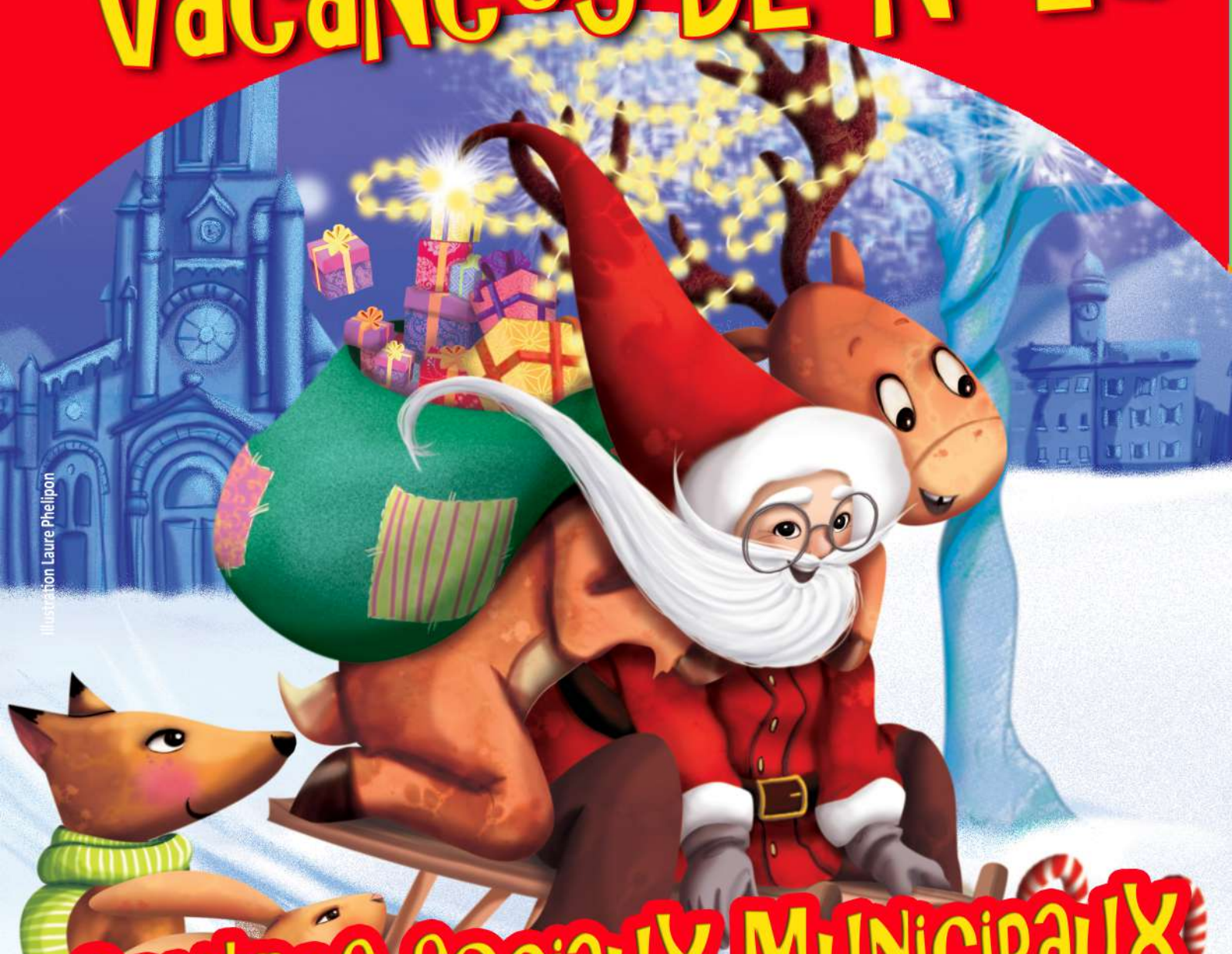
Illustration Laure Pheilpon

Centres Sociaux Municipaux Mieux vivre ensemble