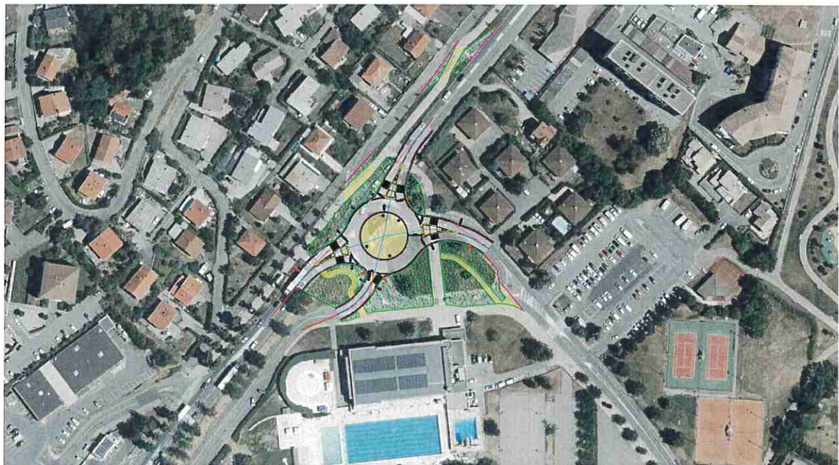
Carrefour des bénévoles